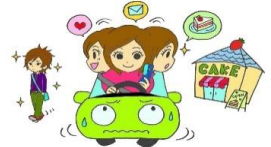
脇見や漫然運転による前方不注意！

死亡事故の主たる原因者(第1当事者)は、 四輪運転者 が全体の 4分の3 を占めます。 四輪運転者の違反は、 前方不注意 や 最高速度違反 が多く、特に3月は年間を通じて最も速度違反が多く認められます。